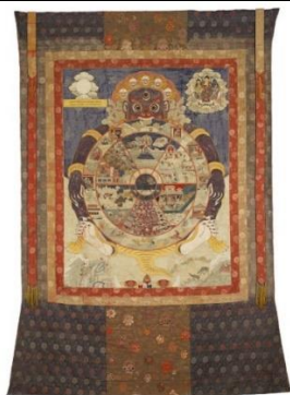
broderie sur soie vers 1800

Il est décrit comme assez fort pour soulever des montagnes, tuer des démons et rivaliser de vitesse avec Garuda, l'oiseau véhicule de Vishnu. Il est le patron des lutteurs, souvent représenté avec une massue. Entre autres nombreux talents, Hanumân est grammairien, ce qui n'est pas sans rappeler le dieu égyptien Thot. Hanumân est le gardien des propriétés et tout fondateur d'un nouveau village se devait d'ériger sa statue. es langurs grandes mâchoires seraient ses descendants. Ils sont respectés et protégés.