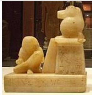
Statuette de Thot, l'enseignant des scribes.

L'un des animaux exotiques (avec le paon) que Salomon fait importer par ses bateaux sur la Mer Rouge (I R 10,22): peut-être est-ce le babouin, que les Égyptiens vénéraient ?