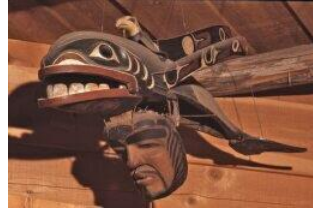
orque avec aigle et visage humain

Dans la communauté Kwakiutl (côte W du Canada) les masques font partie du patrimoine symbolique d'un noble ou d'un chef. Ils sont utilisés lors des représentations religieuses des grandes cérémonies d'hiver, au cours desquelles les esprits prennent place parmi les hommes. Une spécificité : Les masques de transformation sont munis de deux panneaux latéraux qui s'ouvrent, illustrant ainsi la métamorphose du héros mythique du groupe auquel il est associé.