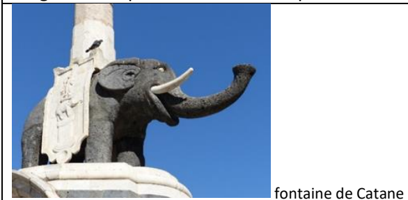
fontaine de Catane

L'éléphant > Allah a dit : « N'as-tu pas vu comment ton Seigneur a agi envers les gens de l'Éléphant ? » S.105, v.1 Dans le Coran, la 105e sourate (la 19e dans l'ordre chronologique) s'intitule Al-Fil (l'Éléphant). Elle comprend cinq versets révélés à la Mecque et doit son nom à l'expression « ashâb al-fil » (les gens de l'éléphant) présente dans le tout premier verset. Cette expression désigne les Abyssins, qui occupaient le Yémen voisin, voulaient évangéliser l'Arabie tout entière, notamment en attaquant la Kaaba, à La Mecque. En raison des entraves qu'ils mettaient au pèlerinage, le « ministre du calendrier » dans le gouvernement mecquois se vengea en profanant l'église de Sana'a. C'est alors que le gouverneur abyssin fit venir un éléphant de taille gigantesque appelé Mahmoud et dirigea une expédition sur La Mecque.