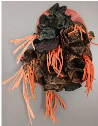
Richard Harding : The Stained Reef, textile 2024