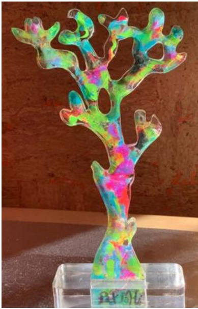
Patmoli : CORAIL22, résine 2022