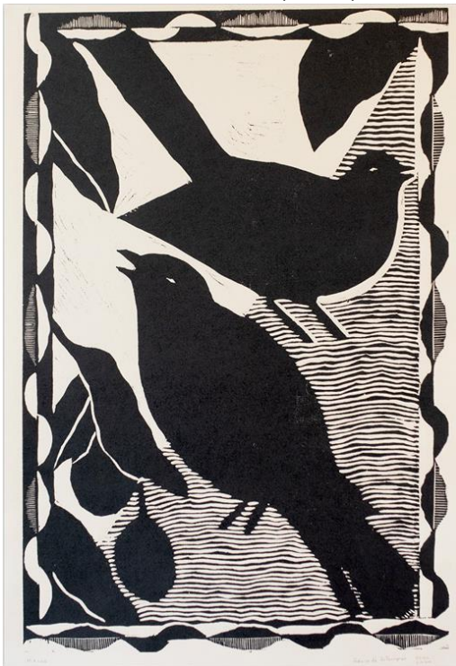
Fabrica de Estampas : Xylographie 2020