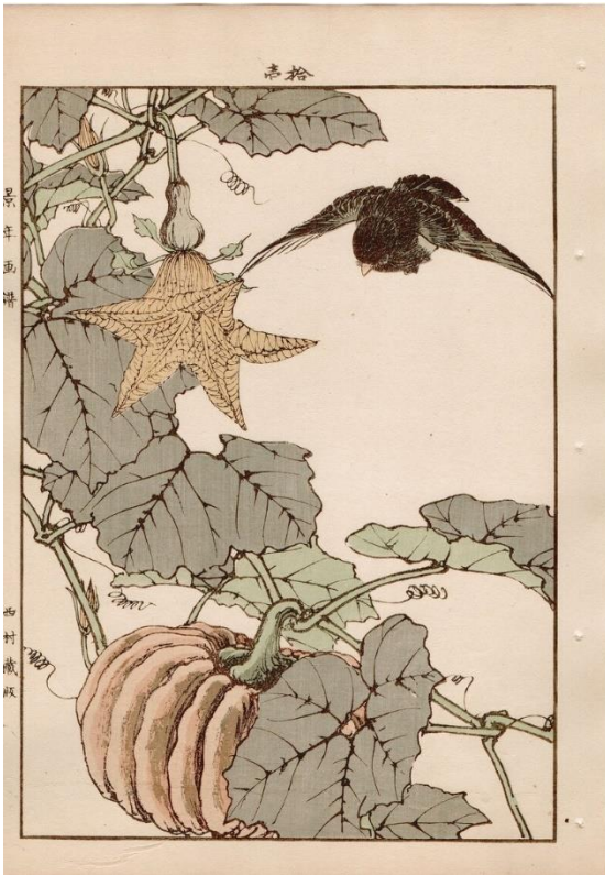
Imao Keinen : Citrouille, merle, 1892